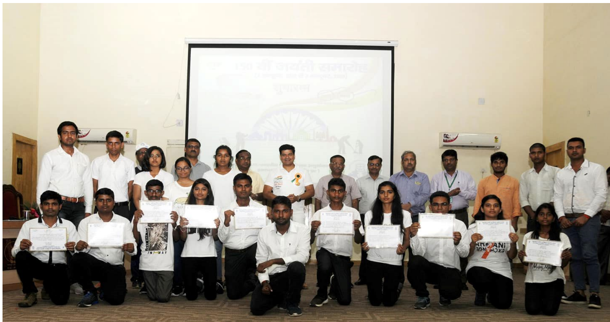
Participants of various competitions with Honorable Director, ICAR-IVRI in valedictory program on 2.10.2018