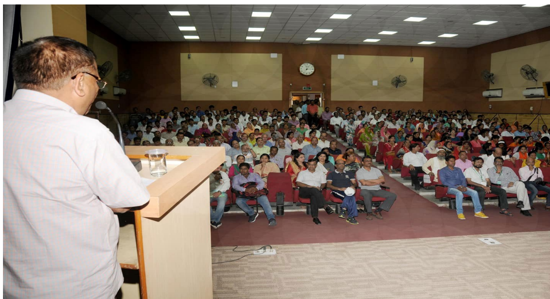
Honorable Director, ICAR-IVRI addressing students, faculty and staff on 2.10.2018