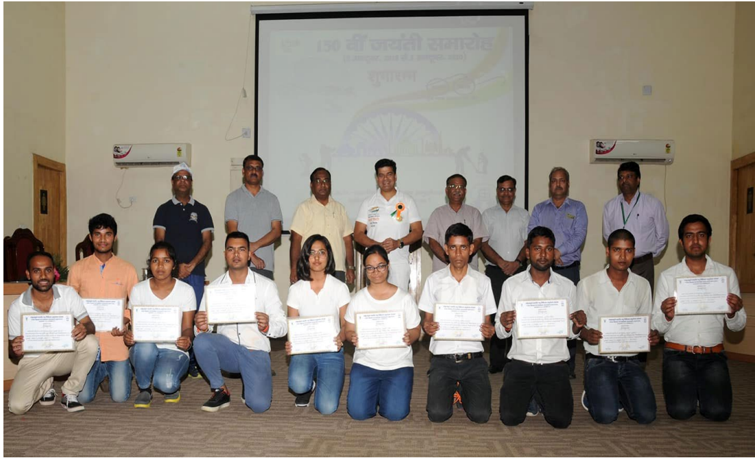
Winners of literary events with Honorable Director, ICAR-IVRI in valedictory program on 2.10.2018