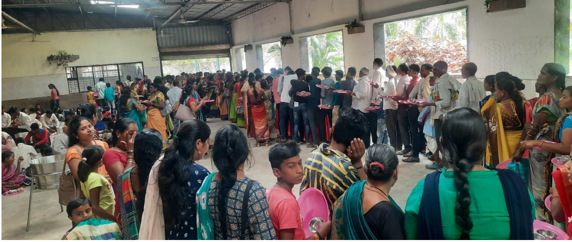
Serving of lunch for the guests and participants