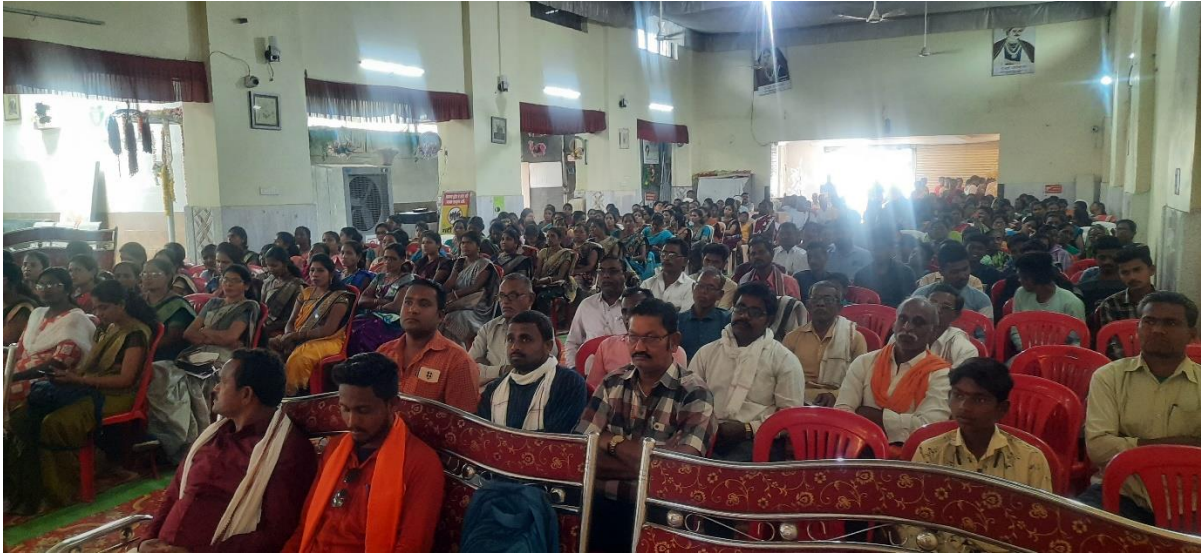
A view of participants of the training