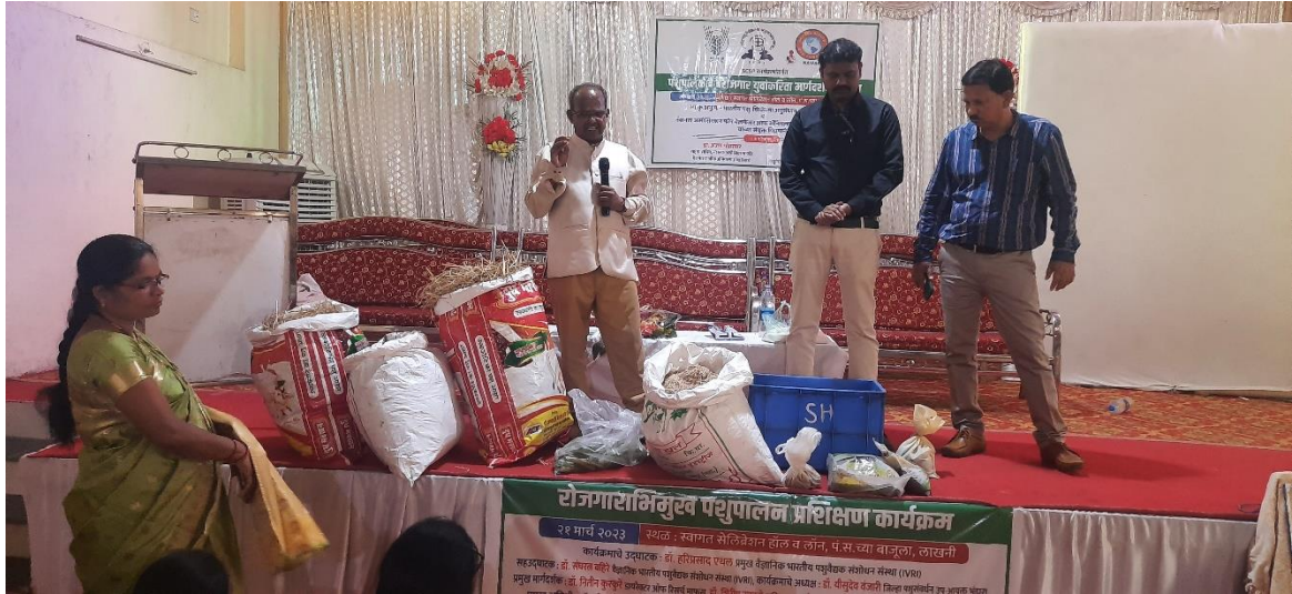
Demonstration on silage making