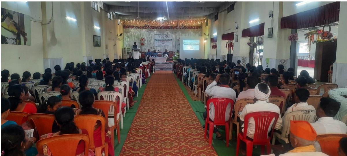
A view of participants of the training