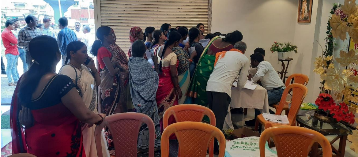
Registration for training