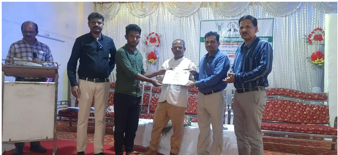
Distribution of certificate to a participant