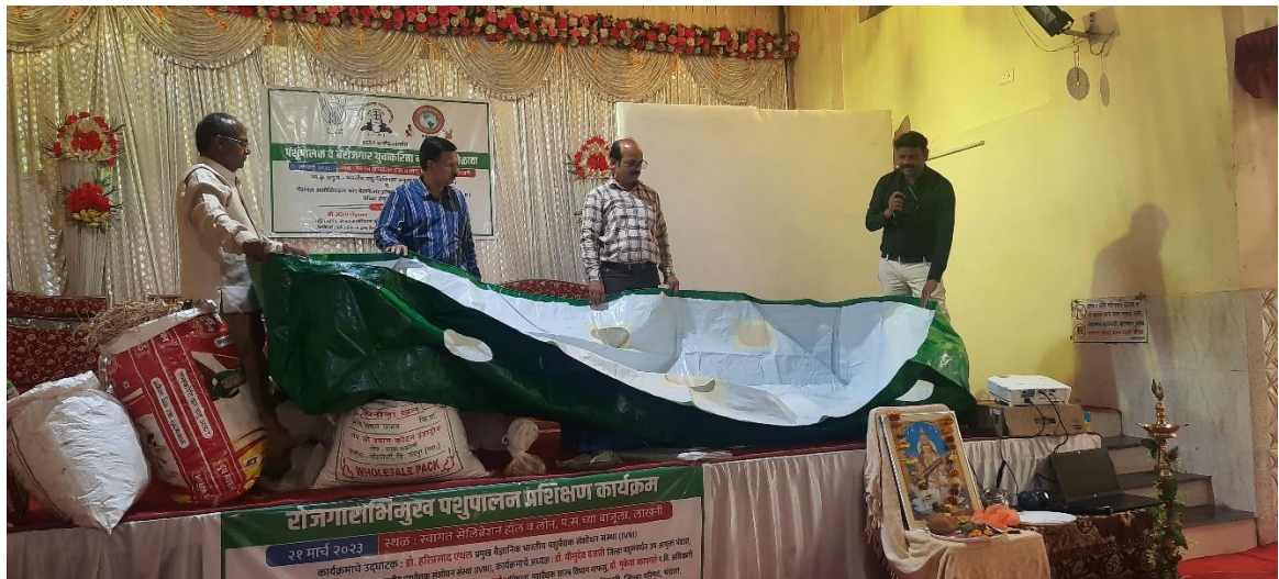
Demonstration on vermicomposting