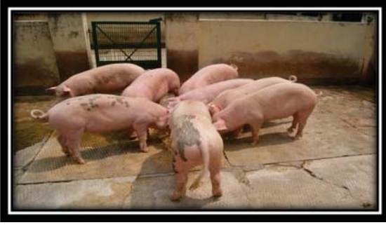
लैंडली: एक संकर प्रजाति सूकर

इस प्रजाति के विकसित विविध प्रकार के सूकरों को सभी प्रकार की स्थितियों में पाला जा सकता है। इन्हें कम खाद्य लागत के संसाधनों के साथ खिलाया जा सकता है। इनकी वृद्धि भी अच्छी रहती है और इनके बच्चों का आकार भी सामान्य रह सकता है। इसलिए इनका उपयोग घर के पिछवाड़े सूकर पालन उद्योग की छोटी इकाईयों जिसमें लगभग 5-20 सूकरों तथा साथ ही साथ बड़ी वाणिज्यिक इकाईयों के रूप में भी किया जा सकता है।