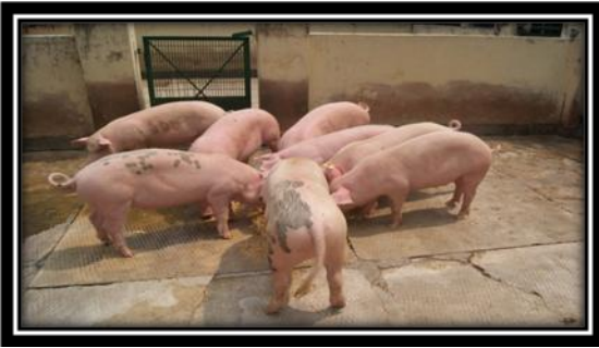
लैंडली: एक संकर प्रजाति सूकर

इस प्रजाति के विकसित विविध प्रकार के सूकरों को सभी प्रकार की स्थितियों में पाला जा सकता है। इन्हें कम खाद्य लागत के संसाधनों के साथ खिलाया जा सकता है। इनकी वृद्धि भी अच्छी रहती है और इनके बच्चों का आकार भी सामान्य रह सकता है। इसलिए इनका उपयोग घर के पिछवाड़े सूकर पालन उद्योग की छोटी इकाईयों जिसमें लगभग 5-20 सूकरों तथा साथ ही साथ बड़ी वाणिज्यिक इकाईयों के रूप में भी किया जा सकता है।